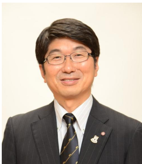
長崎市長 田上 富久

特に平成23年度はゴンドラをリニューアルし、ご好評を頂いているところでもありますが、輸送の安全についても改めて皆様からご意見を頂戴し、安全性のさらなる向上に努めてまいりたいと考えております。